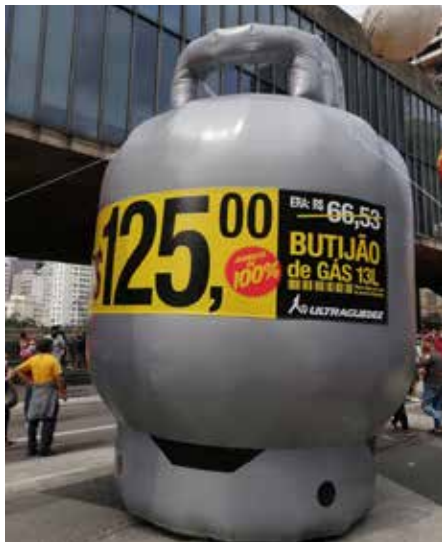
A estrela dos atos de 2 de outubro

flete “parte da elevação nos patamares internacionais de preços de petróleo, impactados pela oferta limitada frente ao crescimento da demanda mundial, e da taxa de câmbio, dado o fortalecimento do dólar em âmbito global”.