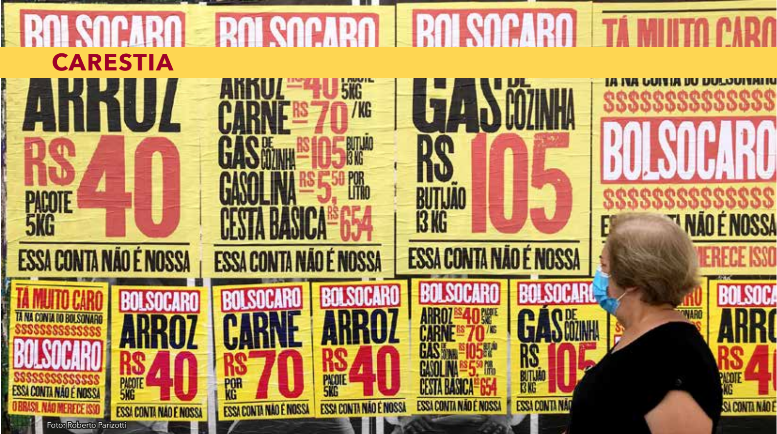
PREÇOS EM ALTA Cartazes de protesto contra o aumento dos preços de produtos na Avenida Paulista, em São Paulo