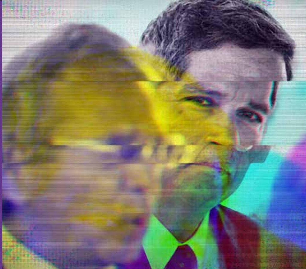
Arte: Olímpio sobre foto da Agência Brasil

IMPEACHMENT. Ao canal Globonews, Gleisi diz que PT luta por Fora, Bolsonaro