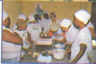
Laboratório Integrado de Desenvolvimento Comunitário promovido pelo SACI no Povoado Mussuca/Laranjeiras.