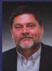
Paulo Frateschi Presidente Estadual do PT-SP

o companheiro Genoino . No Encontro Estadual de Serra Negra, o nome do nosso companheiro Mercadante foi indicado para disputa do Senado, onde deverá representar São Paulo, ao lado do senador Suplicy . Nosso time se completou com a escolha - também através de uma prévia em que votaram quase 170 mil petistas - do candidato à Presidência da República, nosso companheiro de tantas lutas, o Lula . Sabemos que esse time é de confiança e com ele iremos conquistar grandes vitórias em 2002.