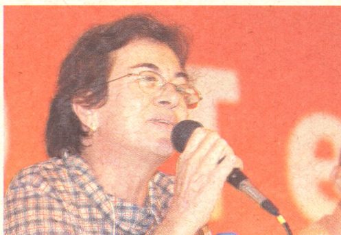
Neusa Cadore, prefeita de Pintadas (BA)