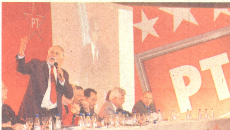
O presidente nacional do PT, José Genoino, abre oficialmente a conferência

Terrorismo em baixa — “A nacionalização da campanha é uma pretensa ameaça dos nossos adversários. Nós não queremos fugir do debate nacional, pois é ele que nos dá razão”, afirmou o líder do PT na Câmara dos Deputados, Arlindo Chinaglia. Segundo ele, a militância não se assusta com terrorismo. “Nós, que nascemos sob o fogo cruzado da elite, conseguimos vitórias como a do presidente Lula e em várias capitais. Portanto não nos assutamos”.