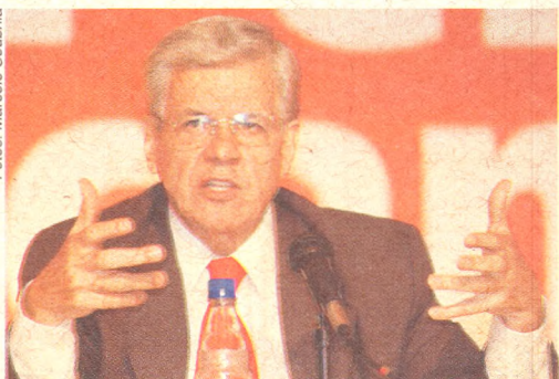
Pedro Wilson, prefeito de Goiânia (GO)