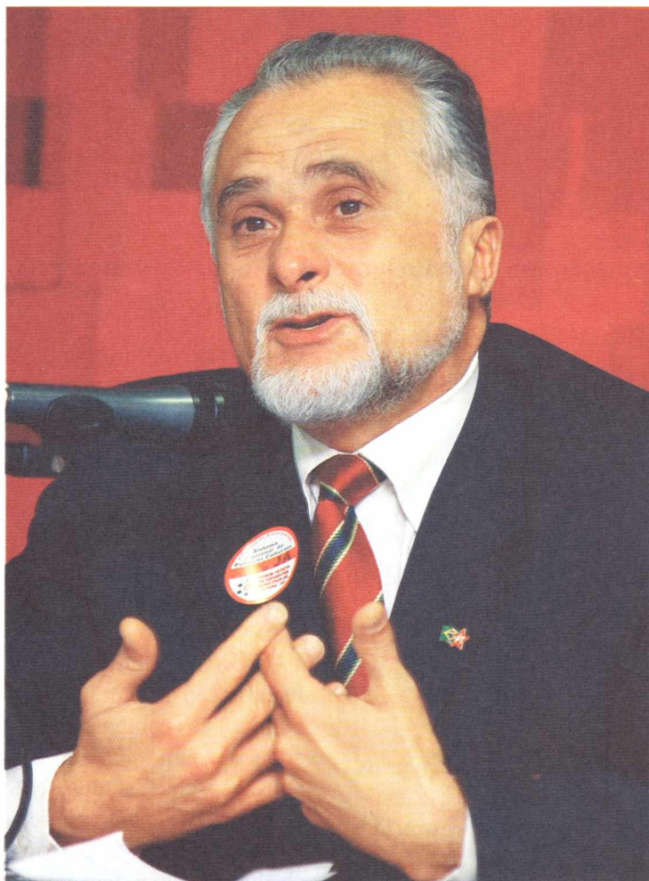
O presidente do PT, José Genoino, durante entrevista