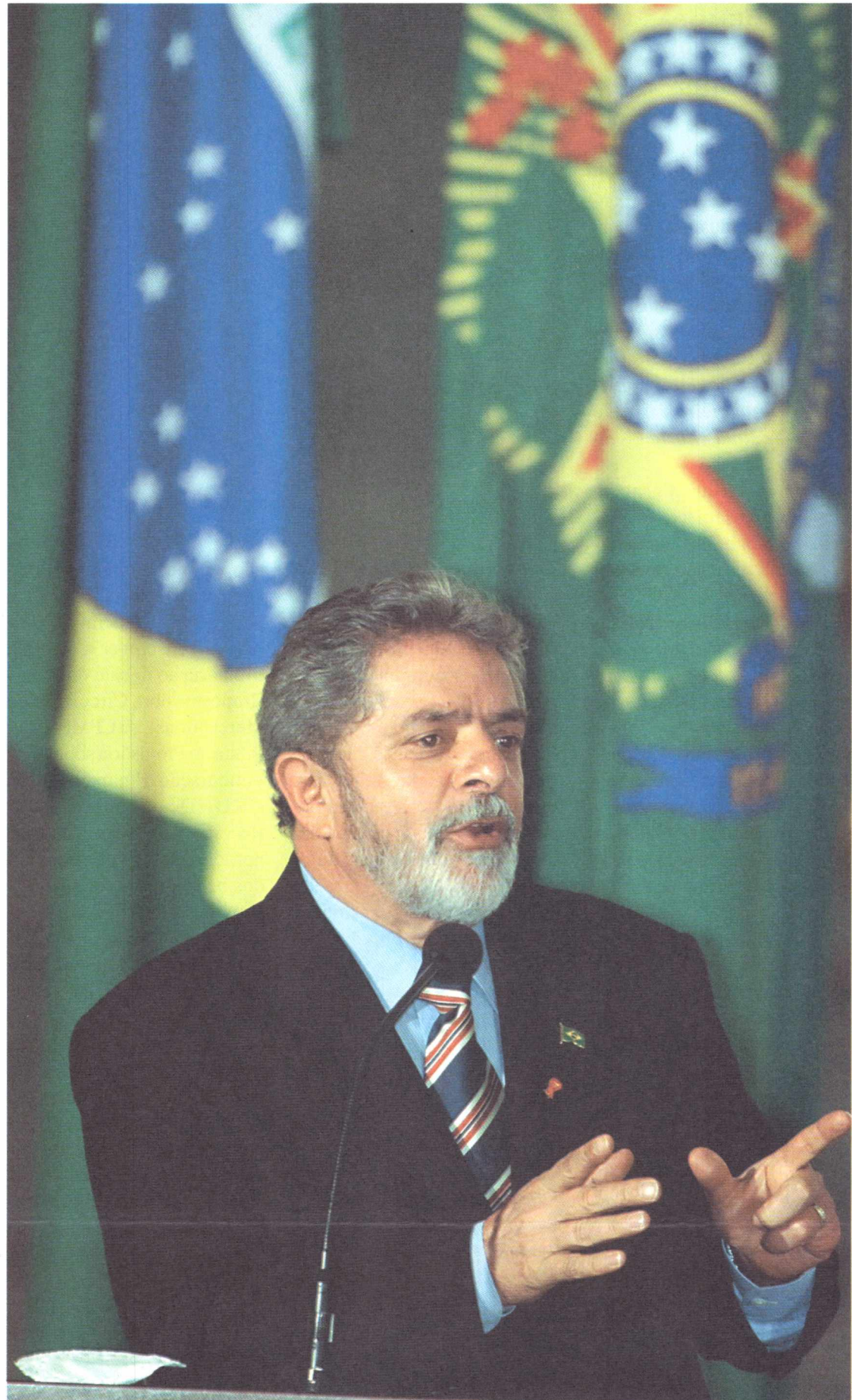
O presidente Luiz Inácio Lula da Silva durante entrega de estudos do Plano Plurianual

Lula - Vamos ver primeiro o que já foi feito. Quando nós tomamos posse, todo brasileiro sabia que a economia estava numa situação difícil e que era preciso recuperar a credibilidade externa. Vamos só lembrar uma coisa: em dezembro do ano passado, a perspectiva de inflação para