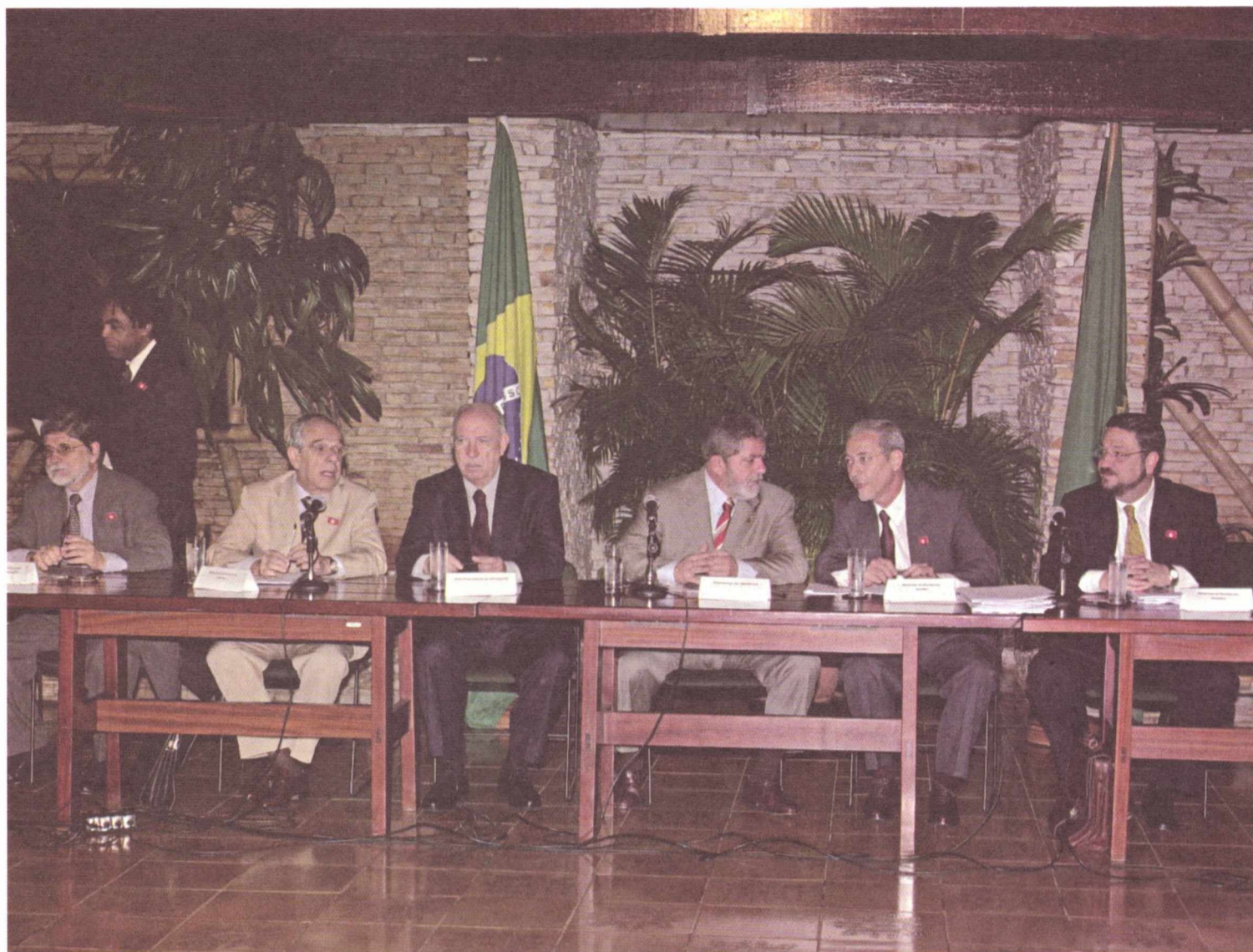
Lula e ministros reunidos na Granja do Torto, quando discutiram o novo Plano Plurianual do governo federal

O PLANO PLURIANUAL, QUE CONTERÁ O PLANEJAMENTO ECONÔMICO DO PAÍS PARA DE 2004 A 2007, RECEBERÁ CONTRIBUIÇÕES DA SOCIEDADE CIVIL