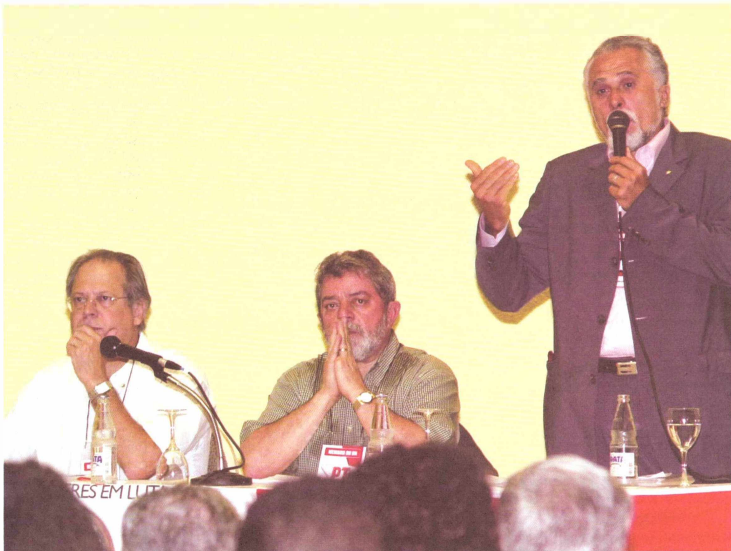
Genoíno abre a primeira reunião do DN após a posse de Lula, que contou com a presença de Lula e ministros

Palocci, por exemplo, reafirmou o compromisso do governo com a estabilidade da economia e mencionou uma série de indicadores positivos registrados desde o início deste ano (leia texto na pág. 7)