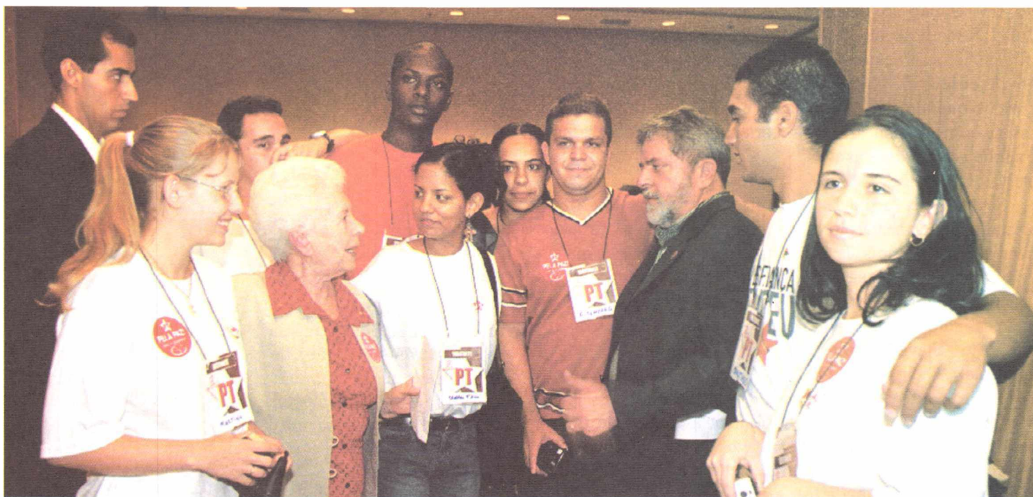
Estudantes que receberam bolsas do governo cubano cumprimentam Lula e Clara Charf na reunião do DN

“A fundação ganha uma nova dimensão, como o partido ganha uma nova dimensão. A um partido nacional como o PT deve corresponder uma fundação nacional, com presença e atividade nas diversas regiões do país. Por isso, a fundação ganha um alcance muito maior”, afirmou Pereira, escritor, poeta e ex-secretário da Cultura do Distrito Federal na gestão de Cristovam Buarque.