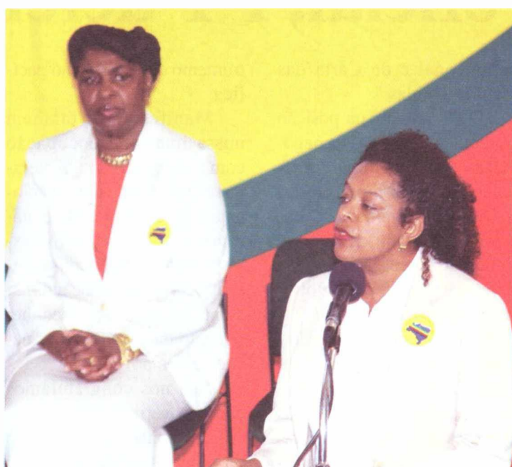
As ministras Benedita da Silva e Matilde Ribeiro (dir.)

Matilde coordenou o programa que levou à elaboração do caderno “Brasil Sem Racismo”, publicado na campanha, e participou da equipe de transição. É doutora em serviço social pela PUC-SP e assessorou o Centro de Estudos sobre Trabalho e Desigualdades e o Sindicato dos Metalúrgicos do ABC.