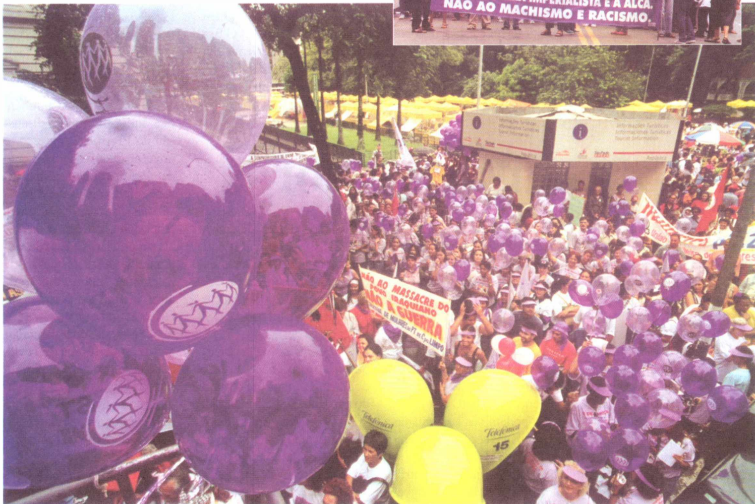
Mulheres participam de manifestação no dia 8 de março, contra a guerra, e no ato realizado no dia 15 (no alto, à dir.)