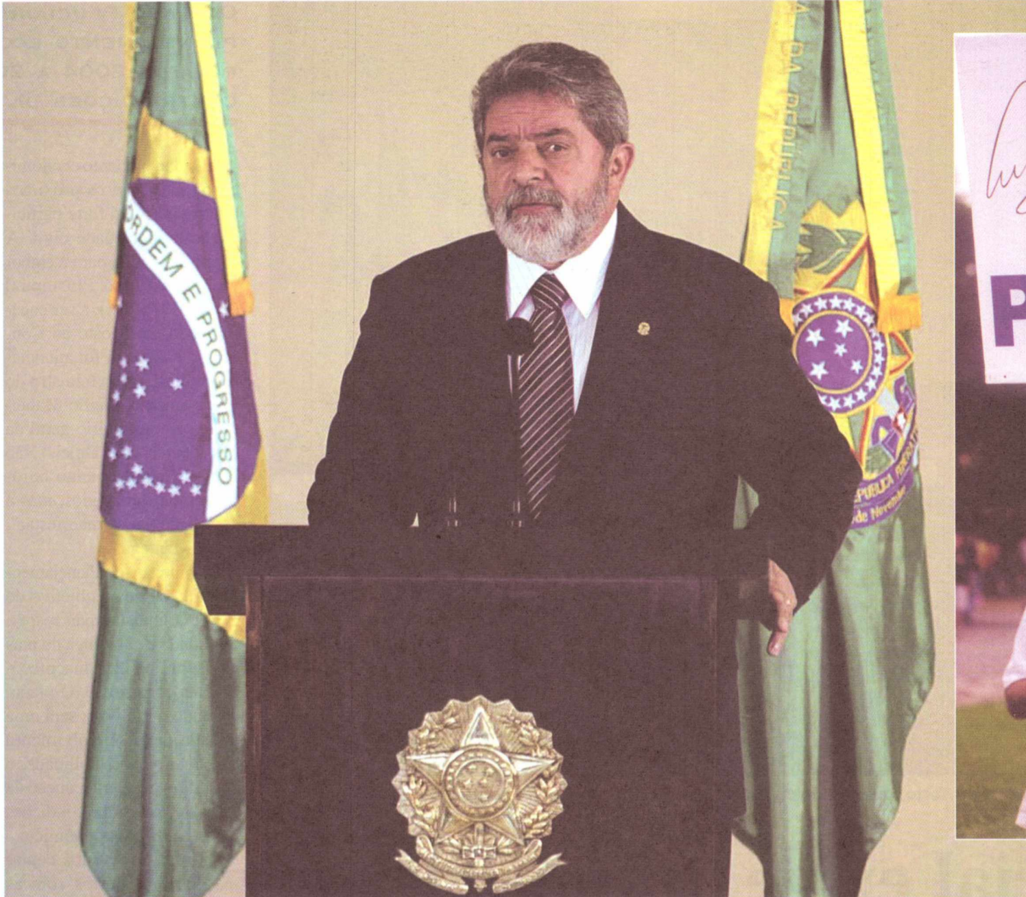
Lula lê o pronunciamento em que manifestou a posição brasileira contrária à ação militar dos EUA no Iraque

Estou certo de que, com todas essas atitudes, interpreto o sentimento do povo brasileiro, que deseja viver num mundo pacífico, em que as normas do direito internacional sejam plenamente respeitadas.