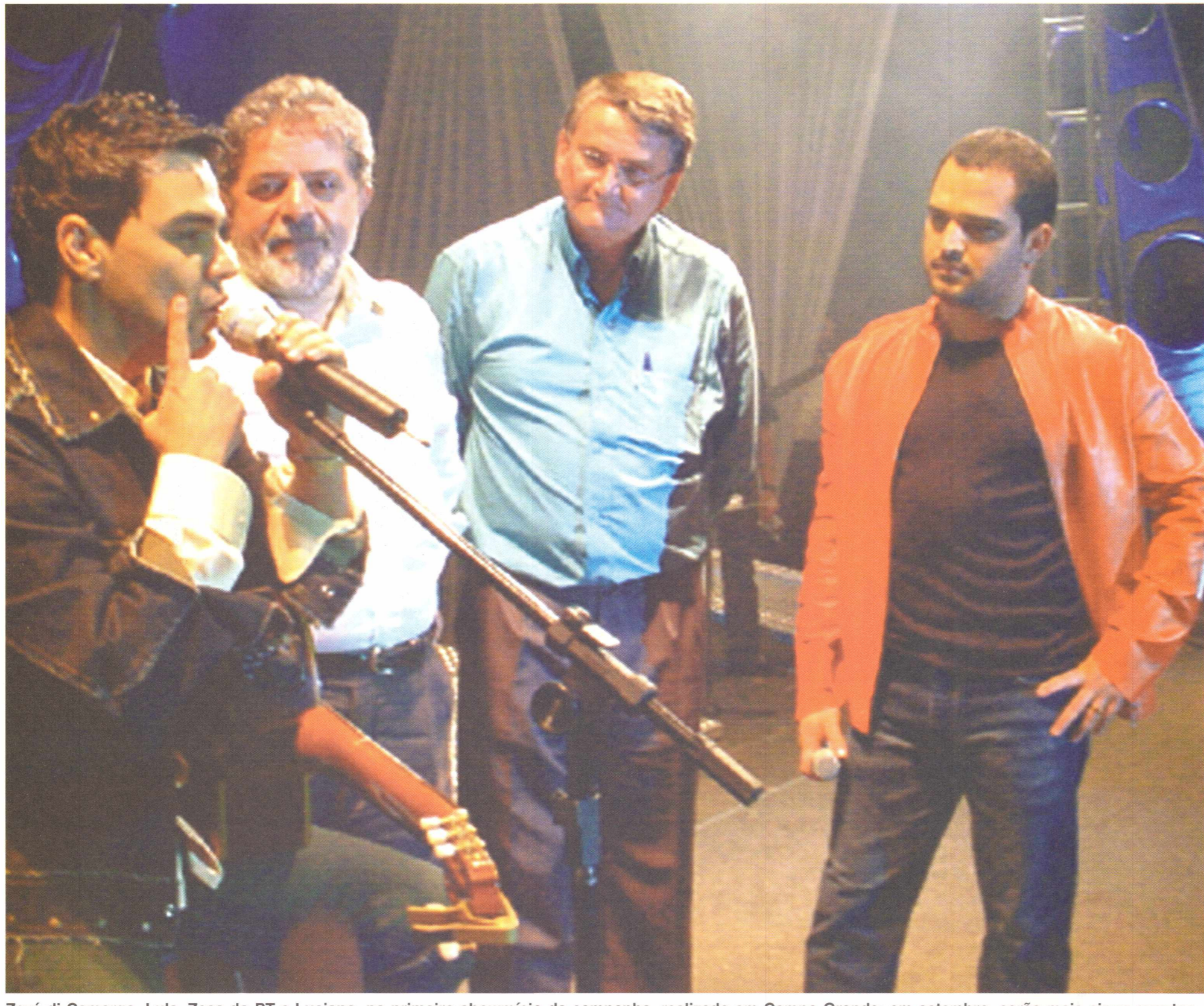
Zezé di Camargo, Lula, Zeca do PT e Luciano, no primeiro showmício da campanha, realizado em Campo Grande; em setembro, serão mais cinco eventos

Essa operação também prevê a constituição de pelo menos um comitê popular em cada município para desenvolver a campanha, diz o presidente nacional do PT e coordenador-geral da campanha Lula Presidente, deputado José Dirceu.