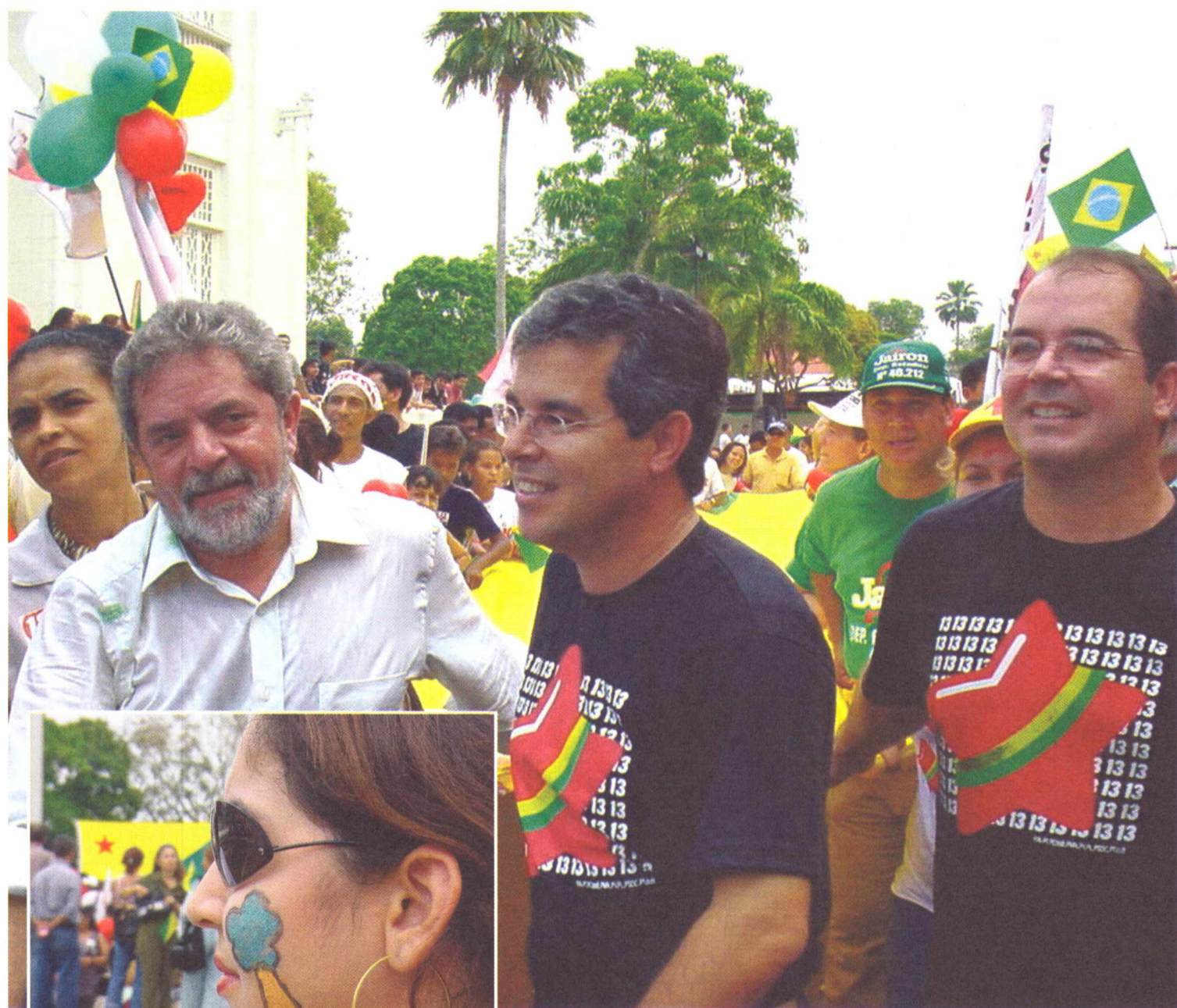
Lula e Jorge Viana participam de caminhada em Rio Branco; ao lado, manifestante protesta contra cassação

O Tribunal Superior Eleitoral cassou, por unanimidade, a decisão do Tribunal Regional Eleitoral do Acre que havia impugnado a candidatura à reeleição do governador Jorge Viana (PT), que lidera a disputa pelo governo do Acre com 62% das preferências nas pesquisas.