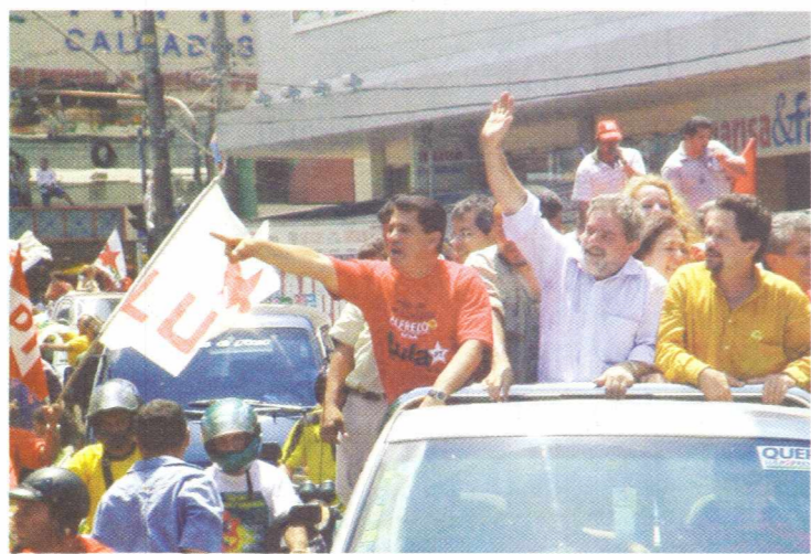
Lula participa de carreta em Manaus