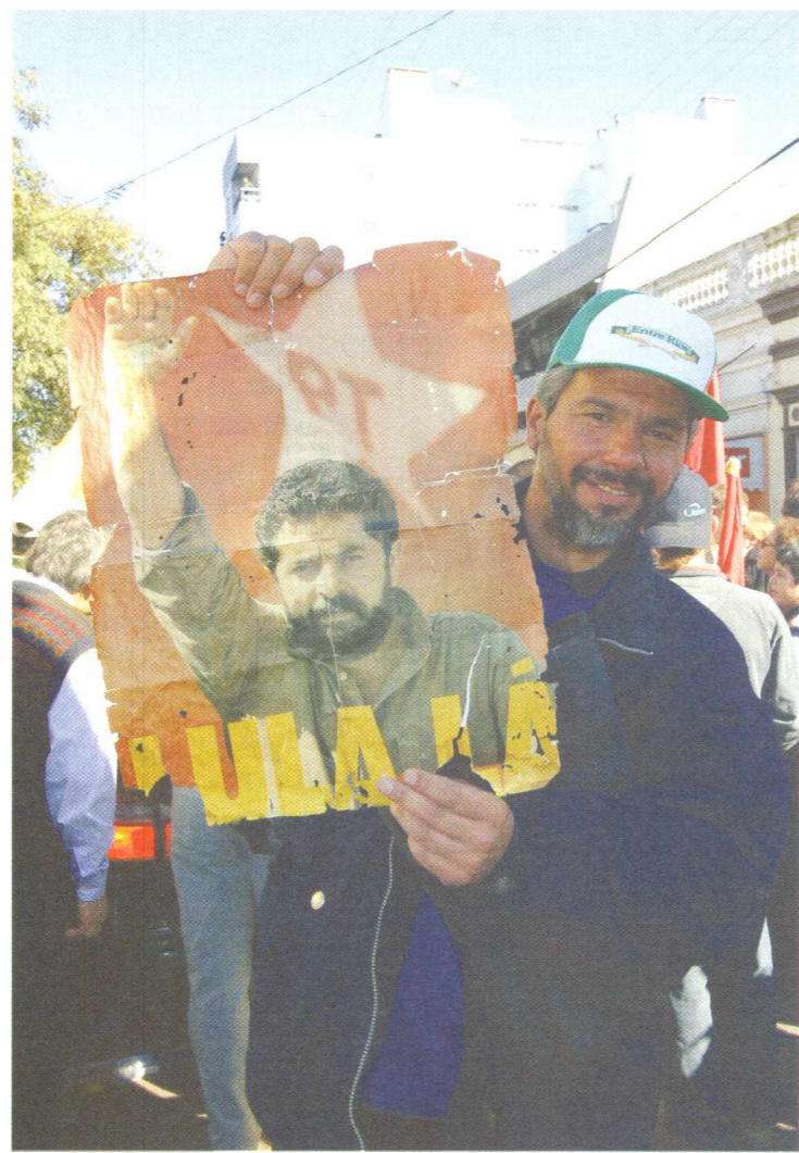
Manifestante segura cartaz da campanha de 89