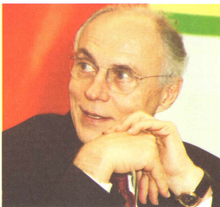
Suplicy na conferência sobre Programa de Governo

Hoje em dia há uma tendência mundial no sentido de reduzir ou limitar a influência do grande capital no resultado eleitoral por meio da implantação ou reestruturação do financiamento público das campanhas. O PT defende três pilares básicos para essa reforma política: fonte única de receita (o