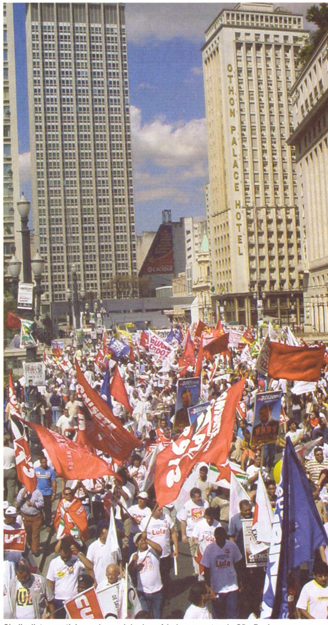
Sindicatistas participam da caminhada pró-Lula no centro de São Paulo

No depoimento, o prefeito fala de experiências premiadas de seu município, como o projeto de universalização do ensino, que hoje comemora o índice de 100% das crianças na escola. A gravação visa