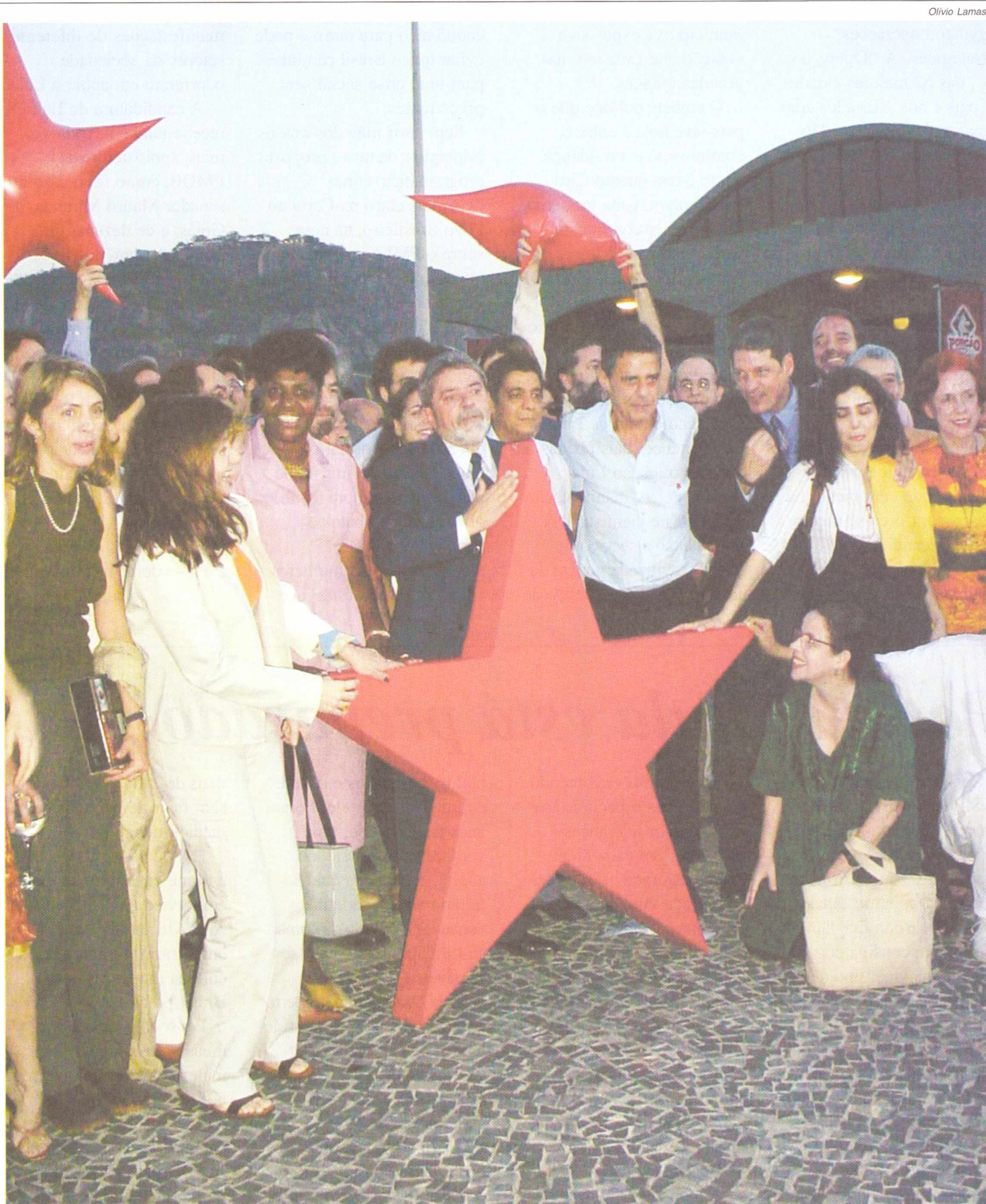
Lula se confraterniza com artistas e intelectuais após ato que marcou lançamento do manifesto a favor do petista

“Queremos que cada militante e cada um dos 2.500 vereadores constituam um comitê popular”, disse Silvio Pereira, secretário nacional de Organização. “Agora acabou a fase do ar-condicionado e do salão acarpetado. Já fizemos todas as reuniões que tínhamos de fazer. Vamos às ruas.”