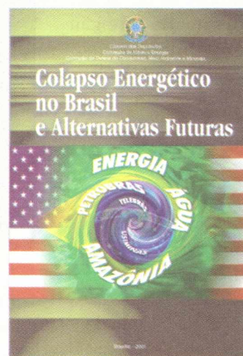
Governo sem luz: em junho de 2000 seminário já alertava para crise energética.

As propostas do PT são a resposta do partido à acusação do presidente Fernando Henrique de que "a oposição não tem propostas", feita durante discurso na convenção nacional do PSDB, no dia 19 de maio.