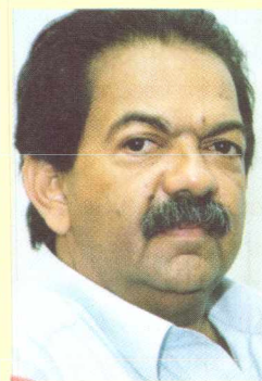
TILDEN SANTIAGO Deputado federal (PT/MG)