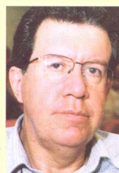
RAUL PONT Ex-prefeito de Porto Alegre