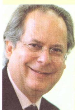
JOSÉ DIRCEU Atual presidente, deputado federal