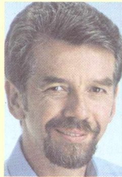
JOSÉ FORTUNATTI Vereador de Porto Alegre