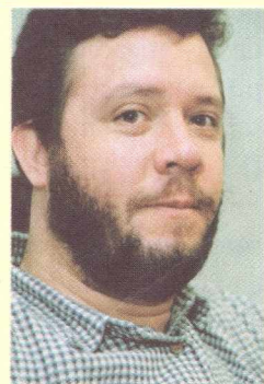
JÚLIO QUADROS Presidente do PT do Rio Grande do Sul