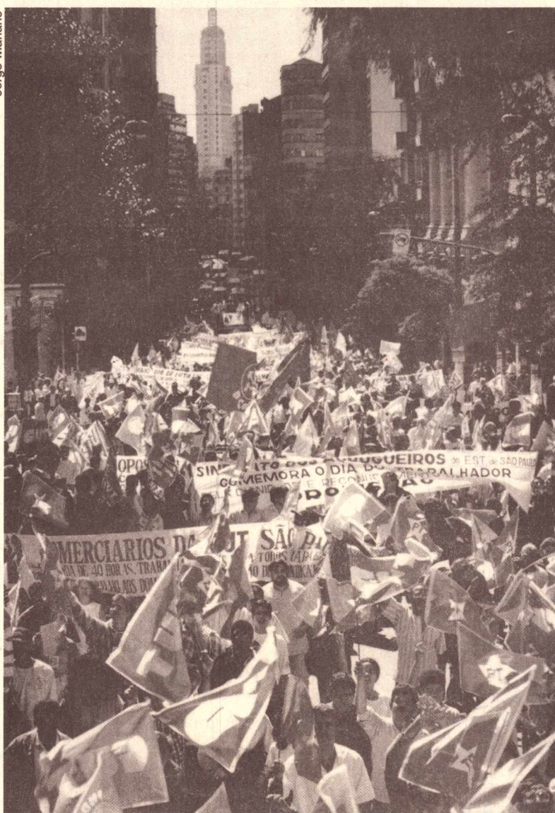
Milhares saem em passeata, em todo o país, pedindo mais emprego

Os detalhes do percurso e calendário foram estabelecidos pelas CUTs Estaduais.