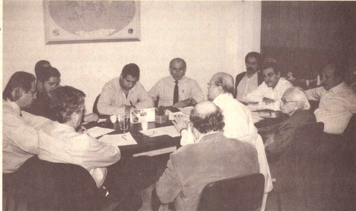
Dirigentes do PT, PDT, PSB e PCdoB reunidos no dia 12 para discutir a Frente de Oposição

"Nessa reunião, tomamos a decisão de colocar na rua as nossas lideranças, em torno da questão da seca, do desemprego, das questões sociais do país, da denúncia da postura autoritária do presidente FHC. A partir de agora vamos sair para as ruas do país. Nossa determinação e decisão é assumir a direção e a liderança da Frente, da insatisfação popular que existe no país e da oposição ao governo de Fernando Henrique", declarou Dirceu.