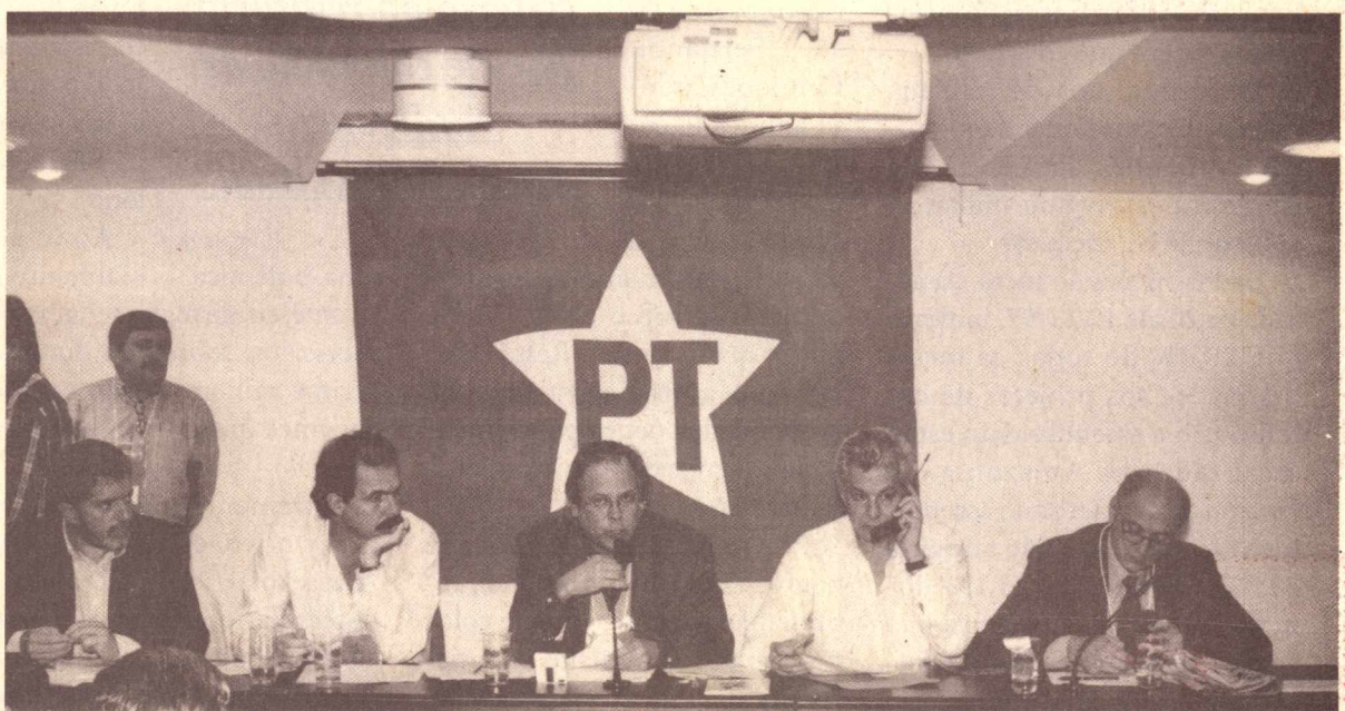
Lula, Mercadante, José Dirceu, Arlindo Chinaglia e Eduardo Suplicy durante reunião do Diretório Nacional

Mas Lula já havia deixado claro que não aceitava essa alternativa: "não tenho duas caras, não vou ter dois palanques", declarou.