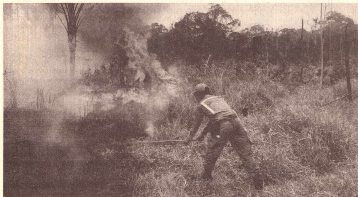
Com equipamento precário, bombeiro tenta conter fogo que se alastra pela vegetação seca

Uma "insensatez". Assim Luiz Inácio Lula da Silva, pré-candidato das oposições à Presidência da República, classificou a política do governo FHC para o meio ambiente, "tratada com poucos recursos e descaso".