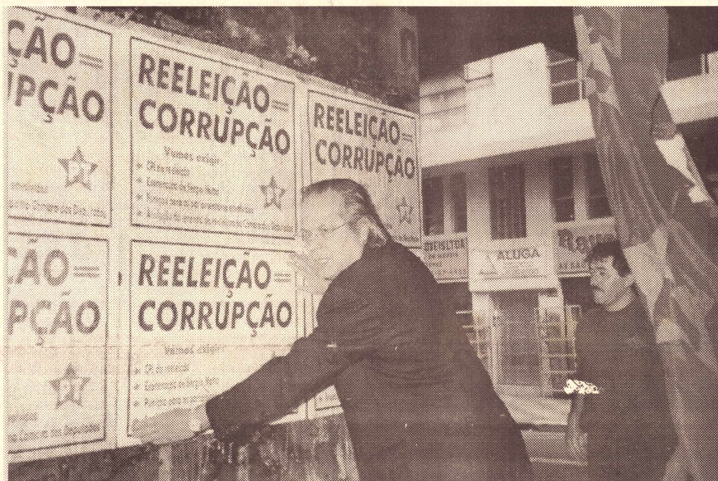
Presidente nacional do PT, José Dirceu, cola cartazes exigindo instalação de CPI para apurar denúncia de compra de votos para aprovação da reeleição, dia 16, no centro da capital paulista, e inicia campanha nacional contra a corrupção

Segundo Dirceu, foi um ato simbólico, para mostrar a indignação da sociedade com as denúncias de corrupção. "Queremos que os petistas de todo o Brasil saiam às ruas para exigir a instalação da CPI", explicou o presidente do PT. "Só a pressão popular fará com que a CPI seja instalada", orientou Dirceu.