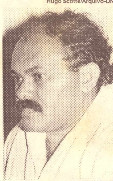
Rocha: momento privilegiado

A necessidade de se realizar os debates antes da votação também é destacada por Rocha: "É possível que já tenham ocorrido vários debates, o que fará com que, no dia do encontro, o filiado vá votar já tendo conhe-