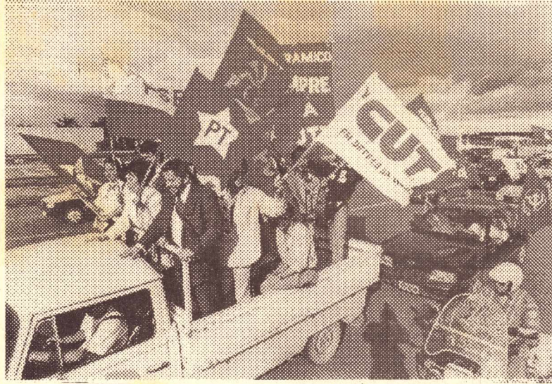
Carreata em Brasília, em 22 de janeiro: indignação com emenda