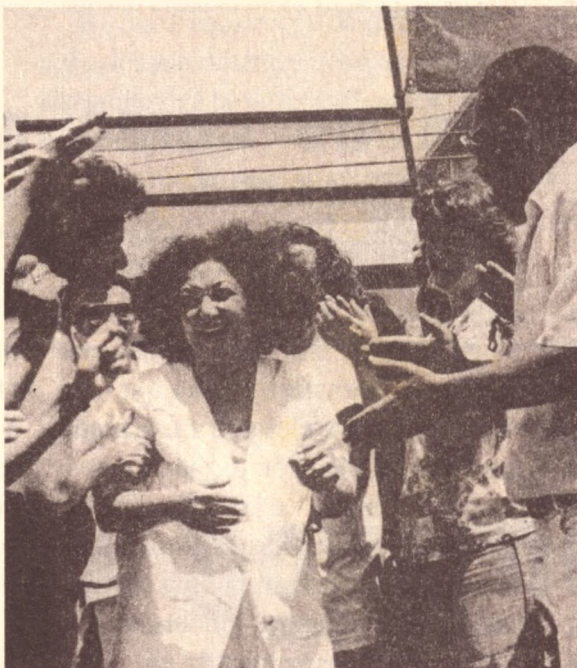
Telma: lição de luta com estivadores

Luta que, agora com a nova ameaça que paira sobre o direito ao trabalho dos avulsos, conta mais uma vez com a solidariedade e apoio con-