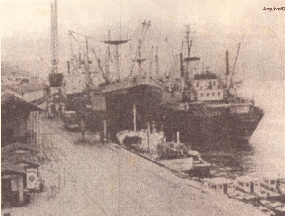
Paralisação no porto de Santos se estende a todo o País

A decisão da Cosipa de operar no porto com pessoal próprio prejudica em torno de 15 mil trabalhadores avulsos, que perdem, com a medida, entre 20 e 25% do mercado de trabalho. Em sua defesa, a empresa, privatizada em 93, alega que não precisa respeitar a lei 8.630 (chamada de Lei da Modernização dos Portos e que obriga os terminais privativos a contratar pessoal entre os trabalhadores sindicalizados) porque fica fora da área do Porto Organizado (toda a orla marítima beneficiada por investimentos públicos).