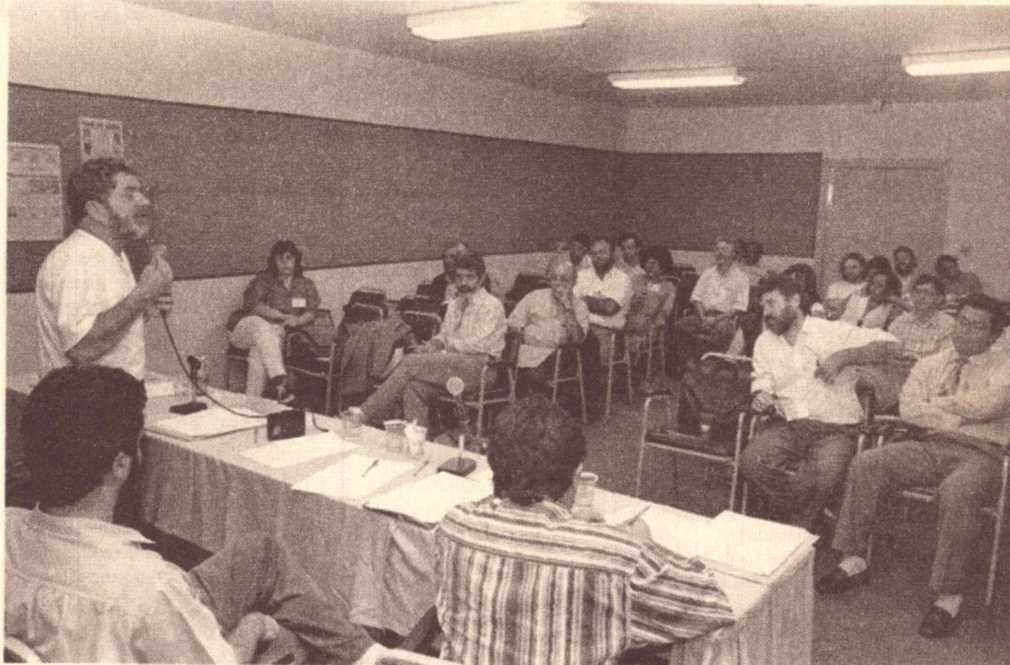
Lula fala sobre a campanha contra o desemprego e a precarização do trabalho e pede o empenho dos dirigentes

A orientação para os Estados que não puderem enviar caravanas a Brasília é organizar alguma atividade regional, como ato público, manifestação, debate, caminhada, pichação. A idéia é que, em cada município em que haja um núcleo ou diretório do PT, o 17 de abril seja marcado como o dia pela reforma agrária e contra a violência e a impunidade no campo.