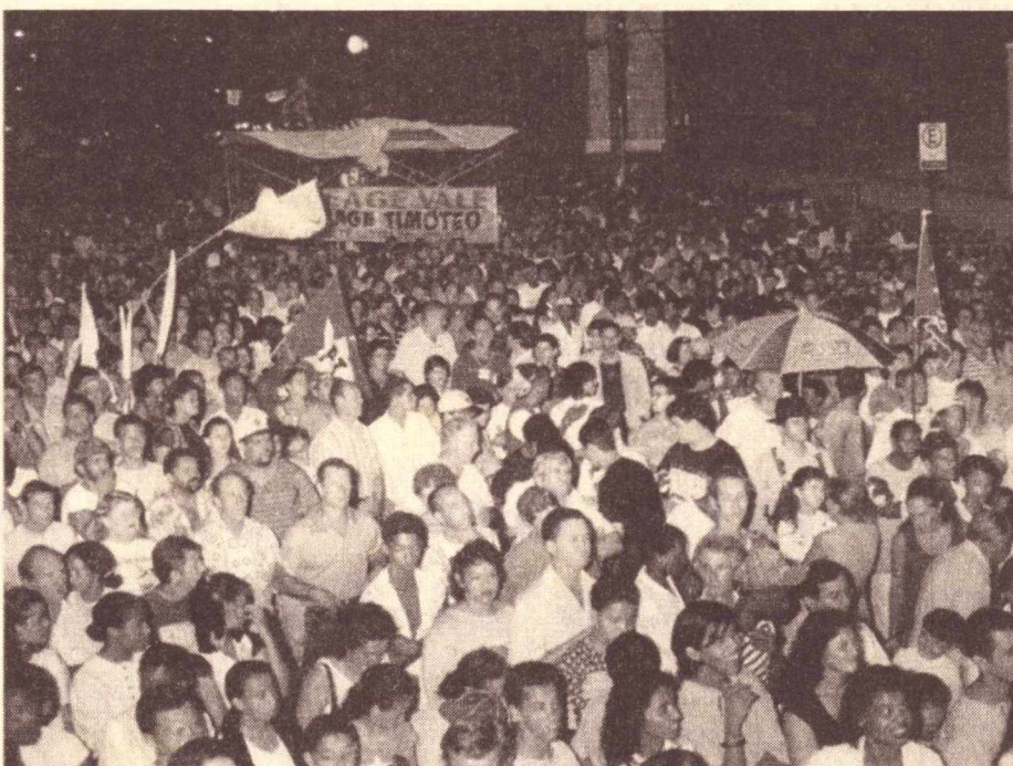
Manifestação contra a venda da Vale em Itabira, em Minas Gerais, em 14 de março, reuniu 10 mil pessoas: manter a mobilização para o dia 21 de abril

Em outra frente de mobilização, está sendo proposta no Congresso Nacional a constituição de uma Comissão Parlamentar Mista de Inquérito para analisar as irregularidades apontadas no relatório entregue à Comissão Externa da Câ-