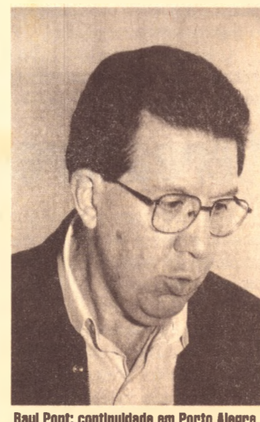
Raul Pont: continuidade em Porto Alegre

Cinco cidades vão para a terceira gestão petista. Além da capital do Rio Grande do Sul, Porto Alegre, dois municípios de Minas Gerais aprovaram mais uma vez o modo petista de governar: Ilicínea e Ipatinga. Os moradores de Icapuí (CE) e Angra dos Reis (RJ) também escolheram a continuidade pela terceira vez consecutiva.