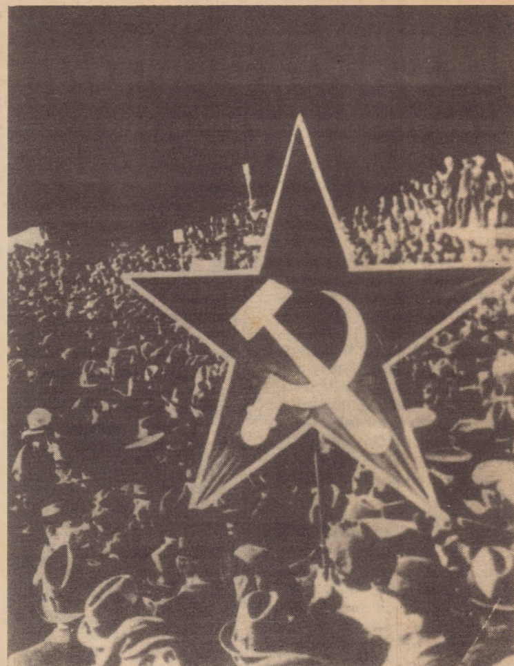
Manifestação espartaquista na Alemanha, 1919

A guerra deteriora a situação interna do país. A crise econômica explode violenta-