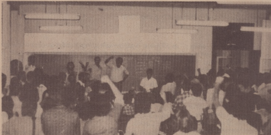
Mais de 500 operários na convenção da Marreta

Nos dias 6, 7 e 8 de março ocorrem as eleições sindicais mais importantes do ano no Rio Grande do Sul. Três Chapas disputam a direção do Sindicato dos Metalúrgicos de São Leopoldo. Localizado no Vale do Rio dos Sinos, principal concentração operária do estado, o Sindicato dos Metalúrgicos abrange seis municípios, tem 25 mil trabalhadores na base e cerca de quatro mil sócios.