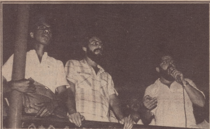
Lula: o PT será o partido do não até que os trabalhadores estejam no poder

"Com a chegada do Partido dos Trabalhadores à Câmara as coisas começaram a mudar. O movimento popular se faz presente em todas as sessões. Nossos vereadores têm procurado interligar as lutas populares com o trabalho legislativo. Sempre a partir das discussões e participação do movimento popular, nossos vereadores apresentaram na Câmara diversas propostas de interesse pú-