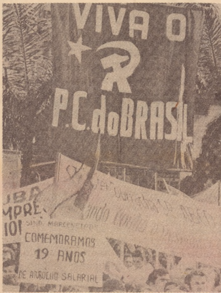
São Paulo: muitas bandeiras e pouca massa

Nas intervenções mais aplaudidas destacaram-se a apresentação de uma plataforma política de resistência à crise, com base na luta pela redução da jornada de trabalho, estabilidade no emprego e reajuste trimestral e propostas concretas de preparação da greve geral. Até julho, quando se realizará o Congresso Estadual de trabalhadores, a pró-CUT tem um calendário de Encontros Regionais, onde serão organizados comandos inter-categorias com objetivo de organizar a greve geral e um fundo de greve.