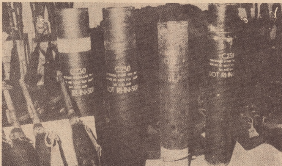
A prova da responsabilidade de Reagan: armas americanastomadas dos invasores somozistas

Nas paredes de barro das casas de El Limón, os sinais do tiroteio. Milicianos que haviam participado no combate ainda discutiam a batalha. Desta vez não houve baixas entre os sandinistas. Em grande medida isto se deveu a