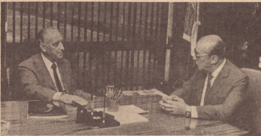
Figueiredo e Montoro: negociação entre pares

Menos de dois meses de governo ajudaram, no entanto, para delimitar os campos. O governo Montoro expressa de variadas maneiras uma atitude de conciliação com a ditadura: na posse um telegrama cordial a Figueiredo, na TV uma discussão amena com o ministro