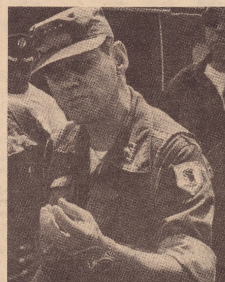
Gustavo Alvarez, o homem forte de Honduras

Caminhando junto com este processo de direitação da vida política hondurenha, o general Alvarez está preparando o seu futuro poder: o Conselho Hondurenho da Empresa