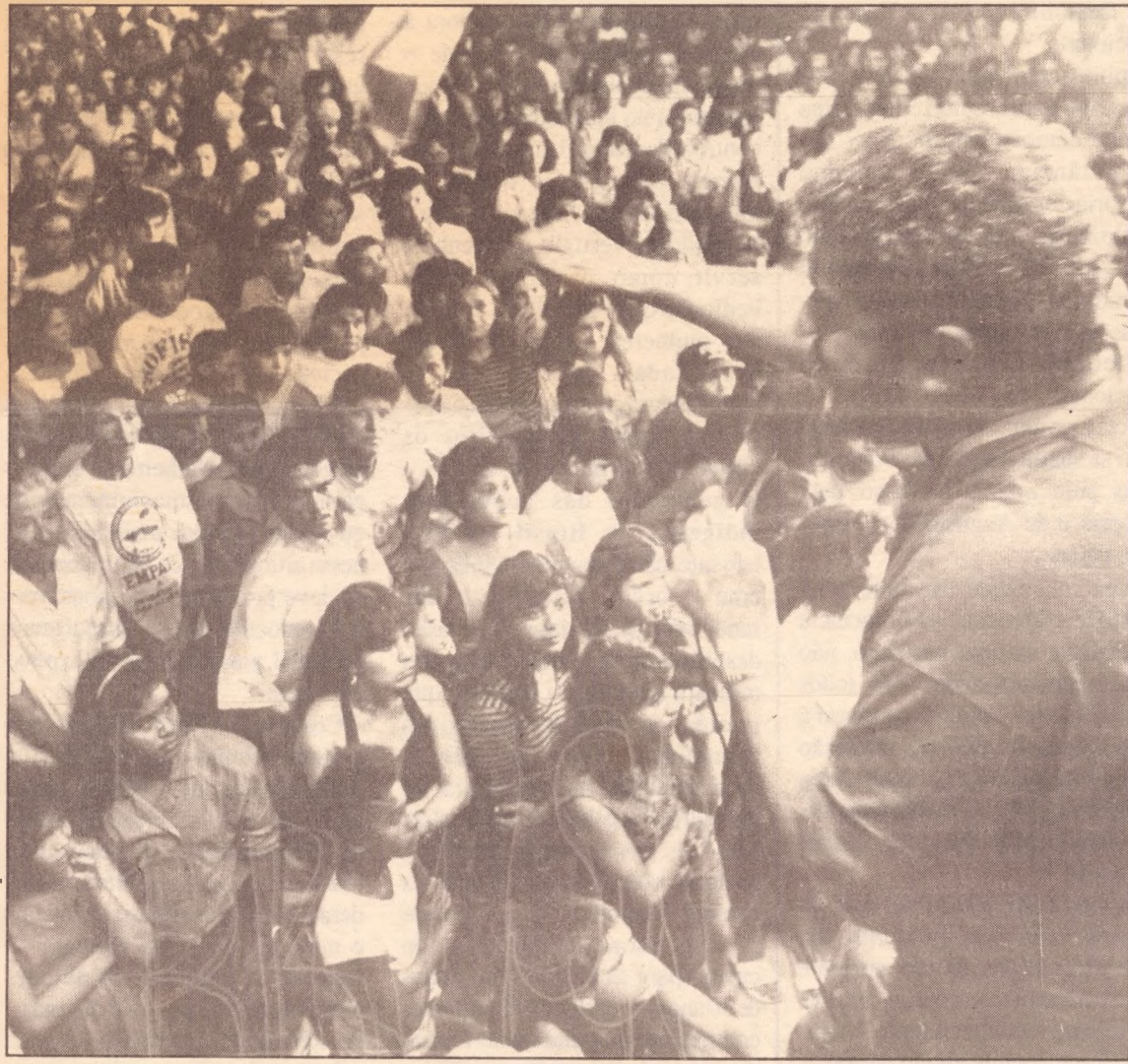
Lula fala aos povos da floresta no Dia da Amazônia - 5 de setembro

Nº 74 - 2ª quinzena de Setembro/93 - CR$ 75,00