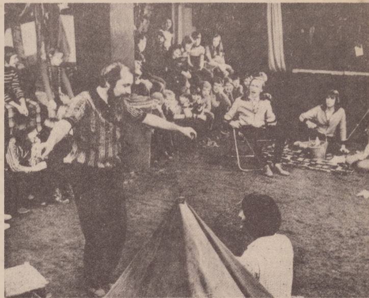
“Ein Fest Bei Papadakis” (uma Festa em casa de Papadakis) mostra às crianças alemãs como é a vida dos que chegam à Alemanha com suas famílias em busca de trabalho

Eles estarão no Encontro Nacional de Teatro Infantil apresentando o seminário “O teatro infantil emancipatório - a criança e seu meio”. O encontro será em Curitiba de 7 a 18 de julho.