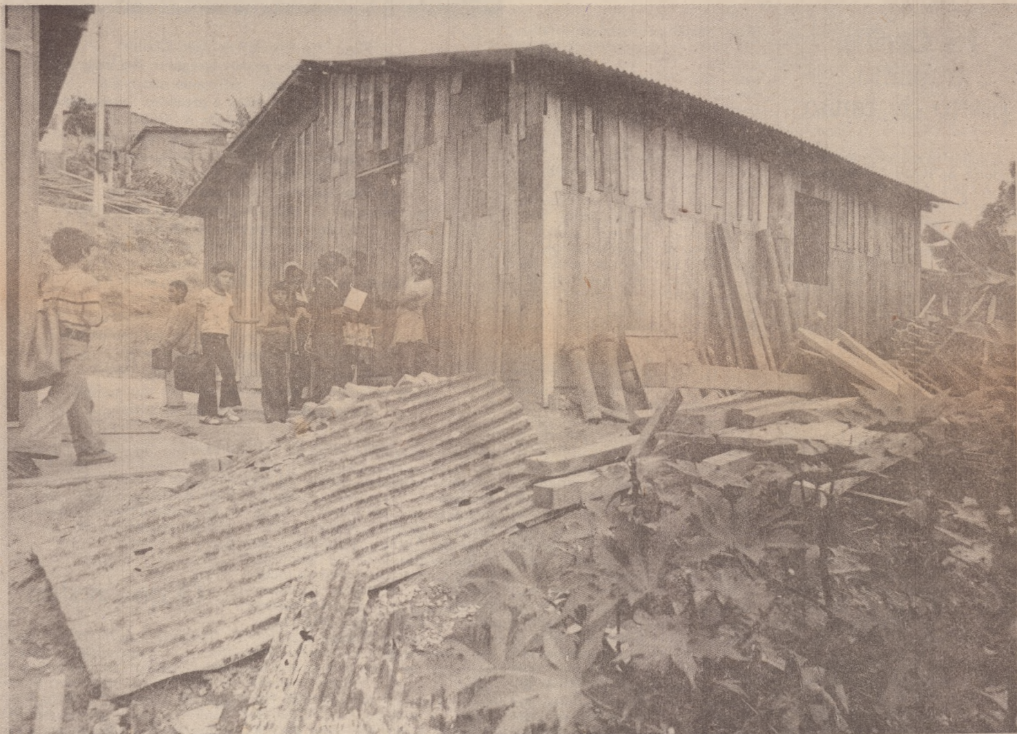
Assim estão as escolas: as mães da periferia de São Paulo buscam uma solução para a educação de seus filhos.

Secretário da Educação (Introdução do Plano de Obras para 1.976, da Secretaria da Educação do Governo do Estado de São Paulo - Projeto de Redistribuição da Rede Física a ser executado até o início do próximo ano letivo.)